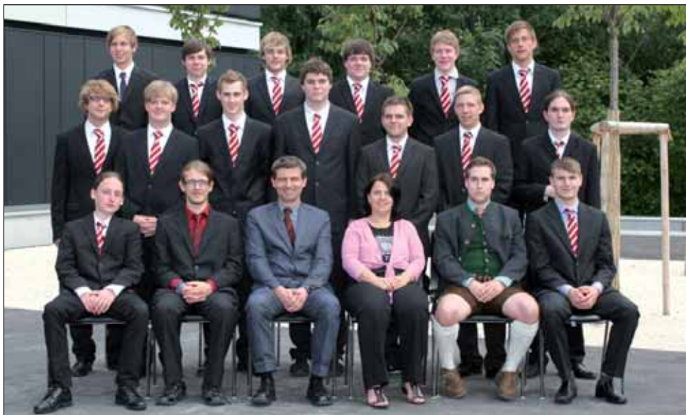
5BHDVK Klasse HTL Grieskirchen (v.l.):