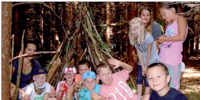
Ferienpass 2013 - ein erlebnisreicher Tag mit dem Alpenverein bei der Schatzsuche

Ferienpass als Download unter: www.grieskirchen.at