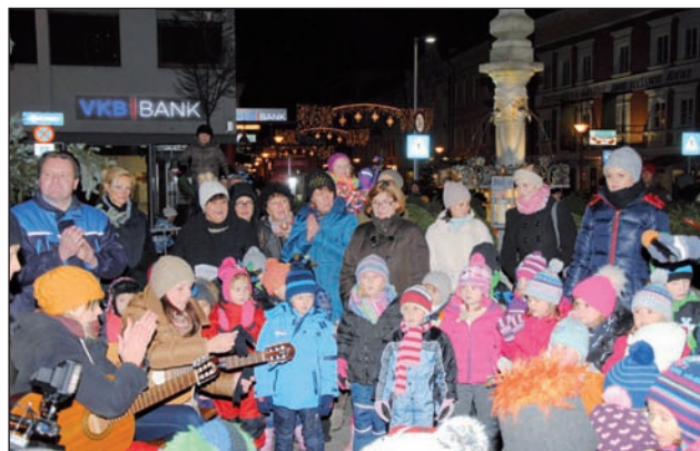
Der Kindergarten Parz stimmte die Besucher auf den Advent ein