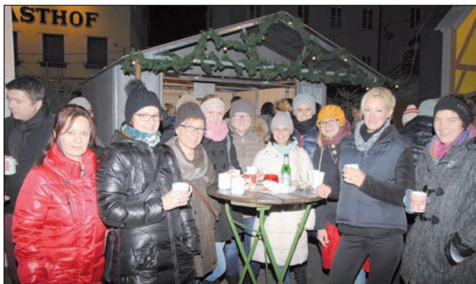
Pädagoginnen-Team des Kindergarten Parz