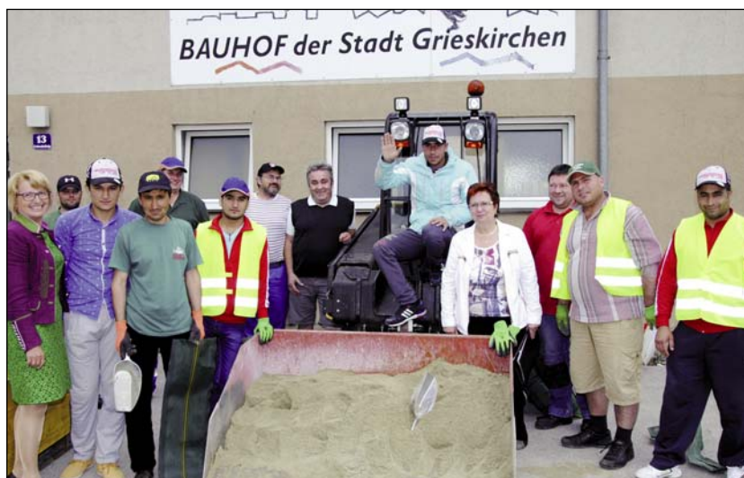
Im städt. Bauhof sind die Flüchtlinge speziell während der Urlaubszeit und zur Überbrückung von arbeitsintensiven Phasen eine große Hilfe.