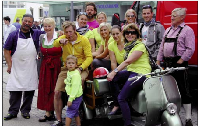
Ein Highlight des ital. Marktes war ein Vespatreffen mit über 40 Teilnehmern.

Das Stadtmarketing dankt den zahlreichen Vespa-Fahrern, die am Samstag am italienischen Markt ihre Lieblingsmodelle präsentierten.