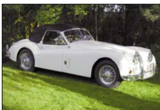
Jaguar XK 140