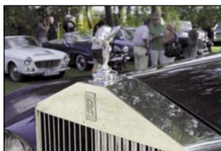
Flying Lady – Rolls Royce

Nähere Informationen: www.landl-rallye.at