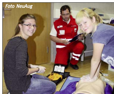
Richtige Erste-Hilfe bei Atem-Kreislaufstillstand – gelernt – geübt – geprüft.