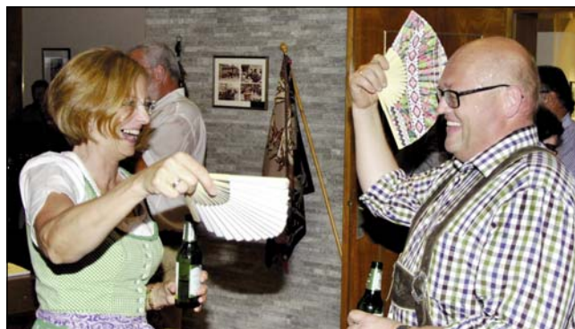
Heiß her ging es nicht wegen hitziger Debatten, sondern wegen der hochsommerlichen Temperaturen.