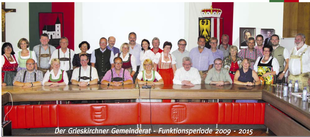
Der Grieskirchner Gemeinderat - Funktionsperiode 2009 - 2015

VITALWELT Bad Schallerbach - Gallspach Grieskirchen - Geboltskirchen Haag am Hausruck - Wallern