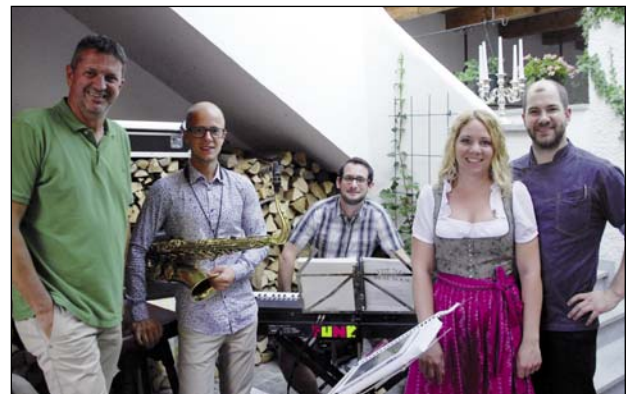
Auftakt der musikalischen Gastgärten im GH Zweimüller

Der Auftakt dieser Initiative erfolgte kürzlich im Gausthaus Zweimüller. Unterschiedliche Ensembles bringen die Musik in die Gastgärten. Die Grieskirchner Gastronomie zählt zweifelsfrei zu den Aushängeschildern unserer Stadt. Unter dem Motto: Entspannen, Seele baumeln lassen und Urlaub machen in der eigenen Stadt mit Musik und Freunden, freut sich das Stadtmarketing Grieskirchen auf schöne Tage in den Gastgärten.