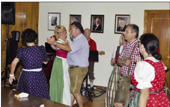
Nach getaner Arbeit wurde der Ausklang der Funktionsperiode 2009 – 2015 gefeiert. Dresscode: Dirndl und Lederhose!