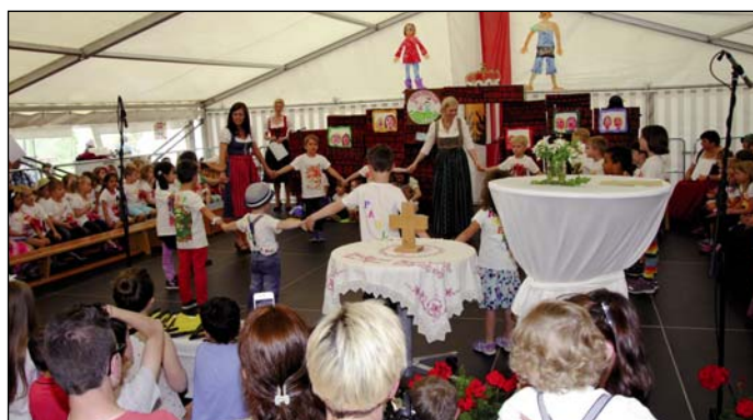
Für die Eröffnungsfeier studierten die Kinder mit dem Betreuungsteam ein buntes Rahmenprogramm ein, das sie stolz ihren Eltern und den Ehrengästen präsentierten.