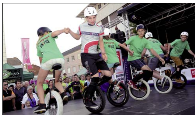
Spektakuläre Showeinlagen von den Unifox-Einradartisten.

Ein tolles Rahmenprogramm mit jeder Menge Musik, Tanz- und Showeinlagen (Liveband „Rock a bissi“, Unifox-Einradartisten, Altschwendter Windradlplattlern, Tanzjugend aus Pollham) rundete die Radsportveranstaltung ab. Unter den Teilnehmern fand man auch ÖSV-Stars - Lizz Görgl und Andrea Fischbacher gewannen die 6 Stunden-Wertung im 2er-Team.