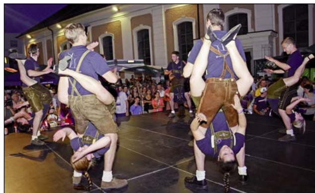
Die Altschwendter Windradlplattler sorgten neben der Liveband „Rock a bissi“ für Stimmung.