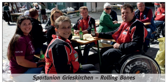
Sportunion Grieskirchen – Rolling Bones