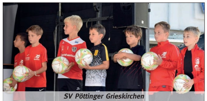
SV Pöttinger Grieskirchen