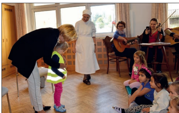
Verteilaktion im Kindergarten der Borromäerinnen