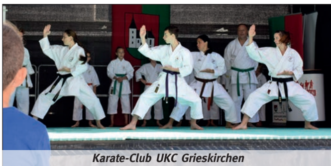
Karate-Club UKC Grieskirchen