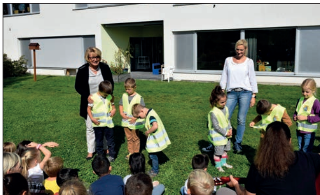
Verteilaktion im Kindergarten Parz