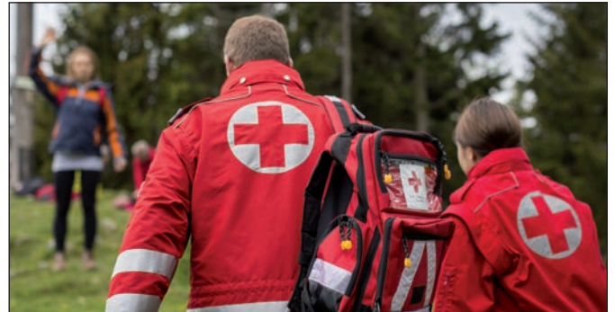
Immer wieder kommt es beim Wandern zu Unfällen.

Im Fall der Fälle richtig zu handeln, kann im Ernstfall Leben retten. Ein Erste-Hilfe-Kurs lohnt sich zu 100 Prozent. Online-Anmeldung und das komplette Erste-Hilfe-Kursangebot unter www.erstehilfe.at