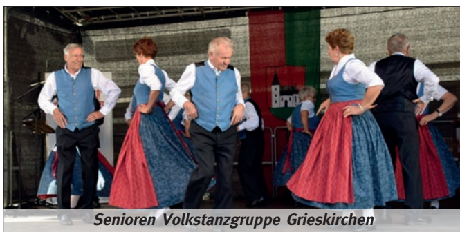
Senioren Volkstanzgruppe Grieskirchen