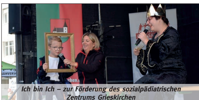
Ich bin Ich – zur Förderung des sozialpädiatrischen Zentrums Grieskirchen