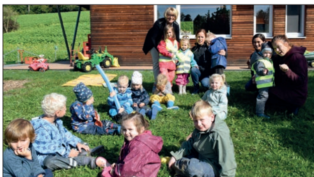
Verteilaktion in der Kindergruppe Pink