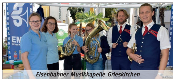
Eisenbahner Musikkapelle Grieskirchen