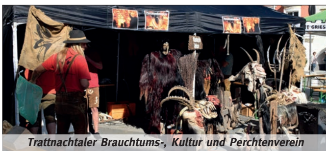
Trattnachtaler Brauchtums-, Kultur und Perchtenverein