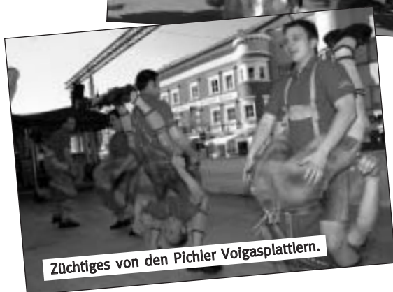
Züchtiges von den Pichler Voigasplattlern.