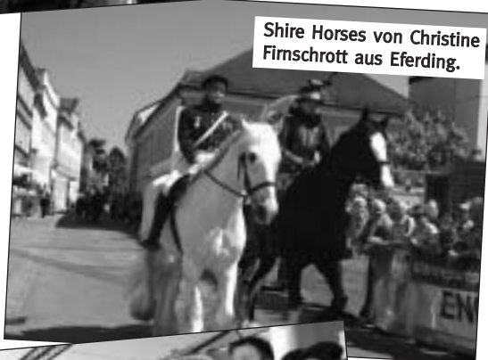
Shire Horses von Christine Firmschrott aus Eferding.