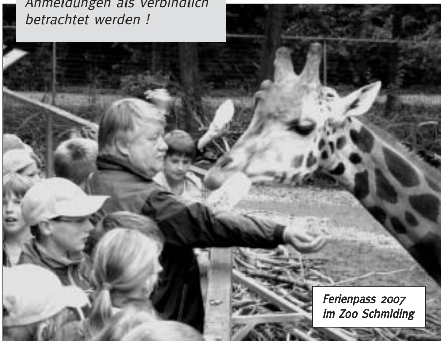
Ferienpass 2007 im Zoo Schmiding

Wer den besten Namen für diese Textilskulptur kreiert, erhält einen Preis. Im Ferienpass 2008 ist ein Teilnahmechein abgedruckt.