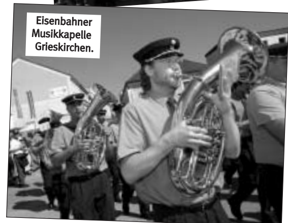
Eisenbahner Musikkapelle Grieskirchen.