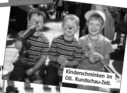
Kinderschminken im Oö. Rundschau-Zelt.