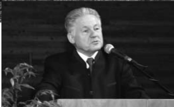
Landeshauptmann Dr. Josef Pühringer: „Jede Investition in die Jugend ist gut angelegtes Geld.“