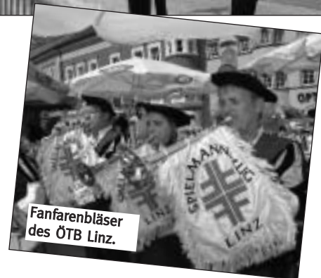
Fanfarenbläser des ÖTB Linz.