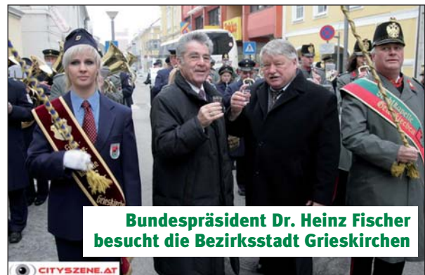
Bundespräsident Dr. Heinz Fischer besucht die Bezirksstadt Grieskirchen