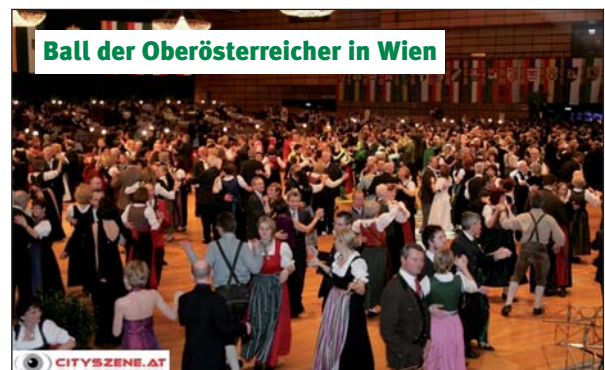
Ball der Oberösterreicher in Wien

Ausführliche Berichte zu diesen Themen folgen in der nächsten Ausgabe des „Aktuellen Rathauses“