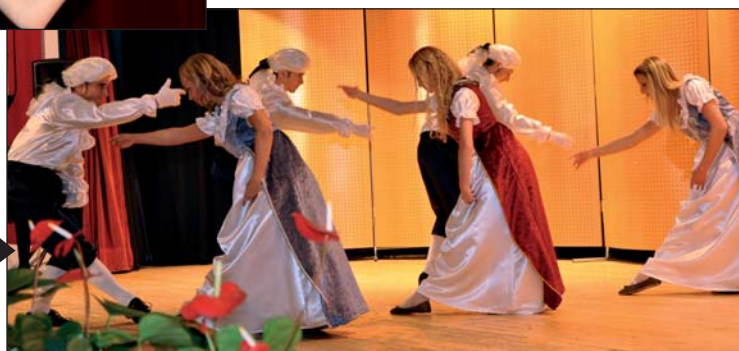
Tanzwerk Wels (Tanzschule Hippmann)