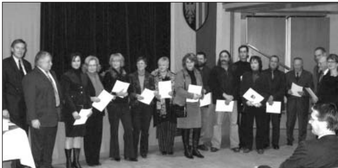
Namhafte Künstler aus der Region gestalteten den Rathaus-Adventkalender 2005