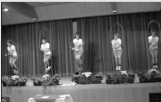
Die Gäste waren von der sportlichen Leistung der Rope Skippers beeindruckt