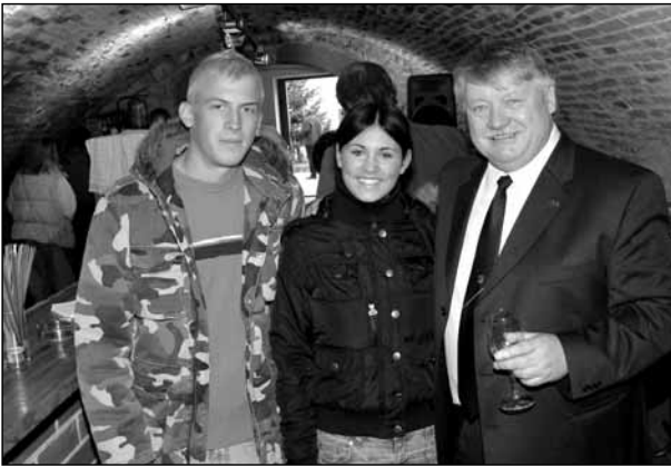
Bürgermeister Wolfgang Großruck freute sich ganz besonders, dass auch viele Jugendliche das Rathaus besuchten.