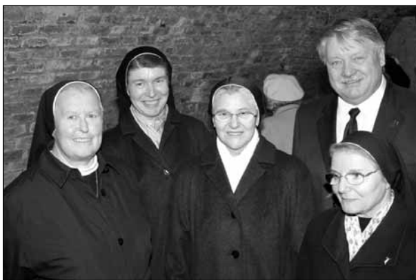
Auch eine Abordnung des Krankenhauses Grieskirchen besuchte das Rathaus.