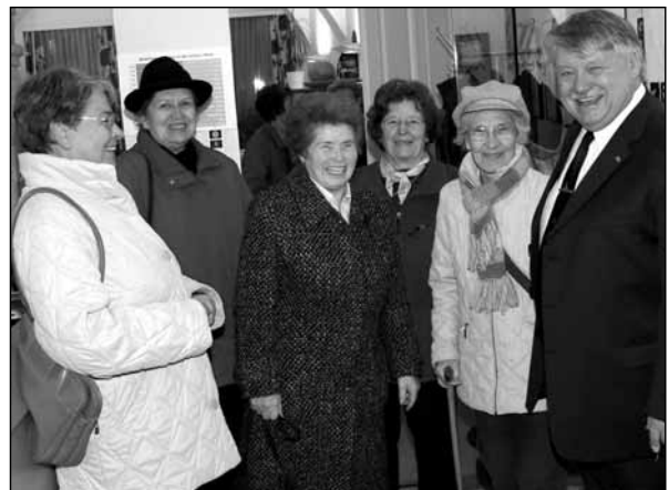
Zahlreiche Gäste informierten sich über die Arbeit der letzten 10 Jahre.