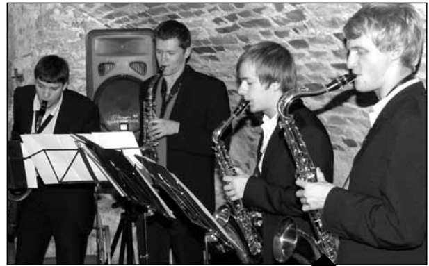
Ein Saxofon-Quartett der Landesmusikschule Grieskirchen und die Trattnachtaler Tanzmusi der Stadtkapelle sorgten im Rathauskeller für Stimmung.