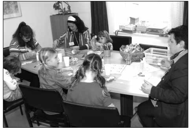
Großen Anklang fand auch die Kinderbetreuung des städt. Kindergartens Annaberg.