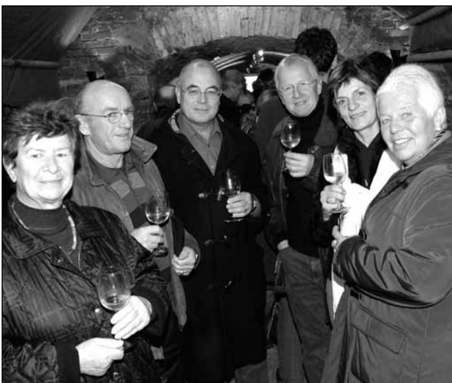
Geselliges Zusammensein im Rathauskeller.