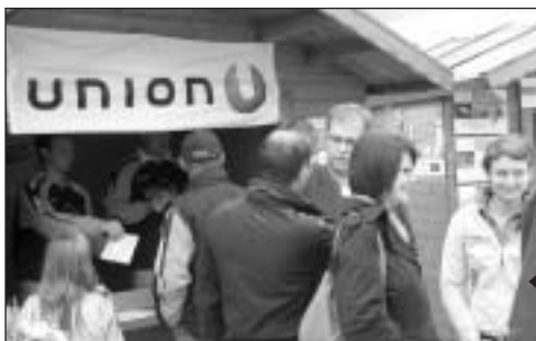
Info-Stand der Sportunion Grieskirchen