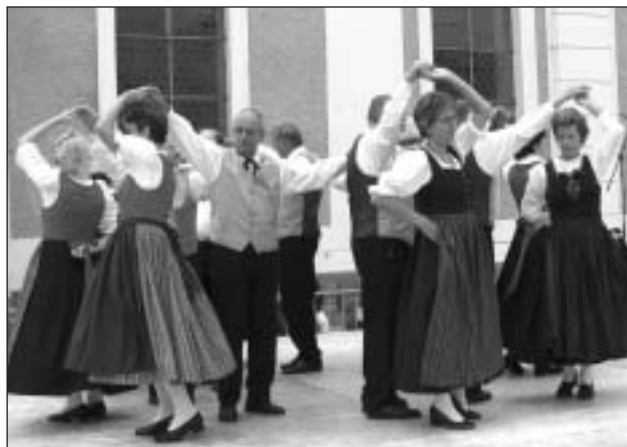
Volkstanzgruppe des Seniorenbundes Grieskirchen