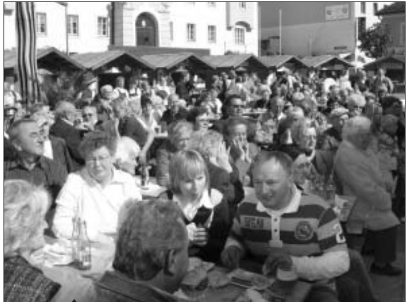
Zahlreiche Besucher verfolgten in geselliger Runde die Darbietungen der Grieskirchner Vereine.

Das Forum Stadtentwicklung Grieskirchen und die Stadtgemeinde Grieskirchen sind über den Verlauf der Veranstaltung sehr zufrieden. Es hat sich auch hier wieder gezeigt, dass sich viel bewegen lässt, wenn alle an einem Strang ziehen. Der Zielsetzung, ein „Vernetzen der Vereine“ zu forcieren, ist man wieder ein Stück näher gekommen.