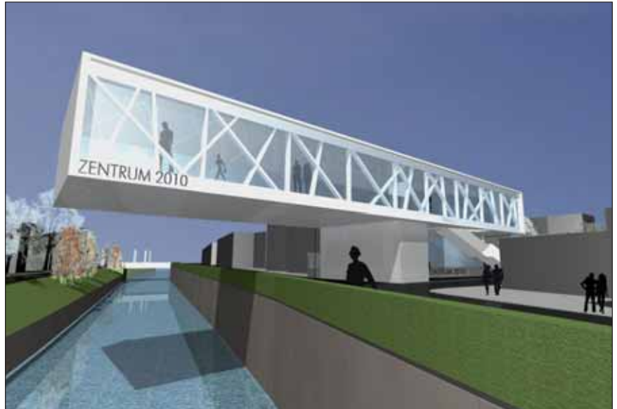
„Zentrum 2010“-Animation: F2-Architekten

Bläserquartett der Eisenbahner Musikkapelle Grieskirchen