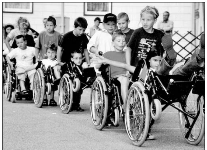
Fotos vom Schulfest, die die vierte Klasse beim "Abschiedslied" zeigen, bzw. die 3. Klasse beim "Rollstuhlballett".

Die Regenbogenschule bedankt sich für das große Engagement aller Beteiligten.