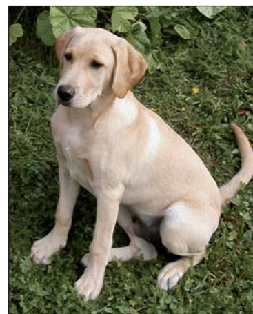
„Vergessene“ Hundstrümmerl sind kein Kavaliersdelikt!

Hundesackerl erhalten Sie kostenlos im Bürgerbüro des Rathauses. Sie können sich auch an einem Spender bedienen, der kürzlich probeweise beim Schwibbogen montiert wurde.